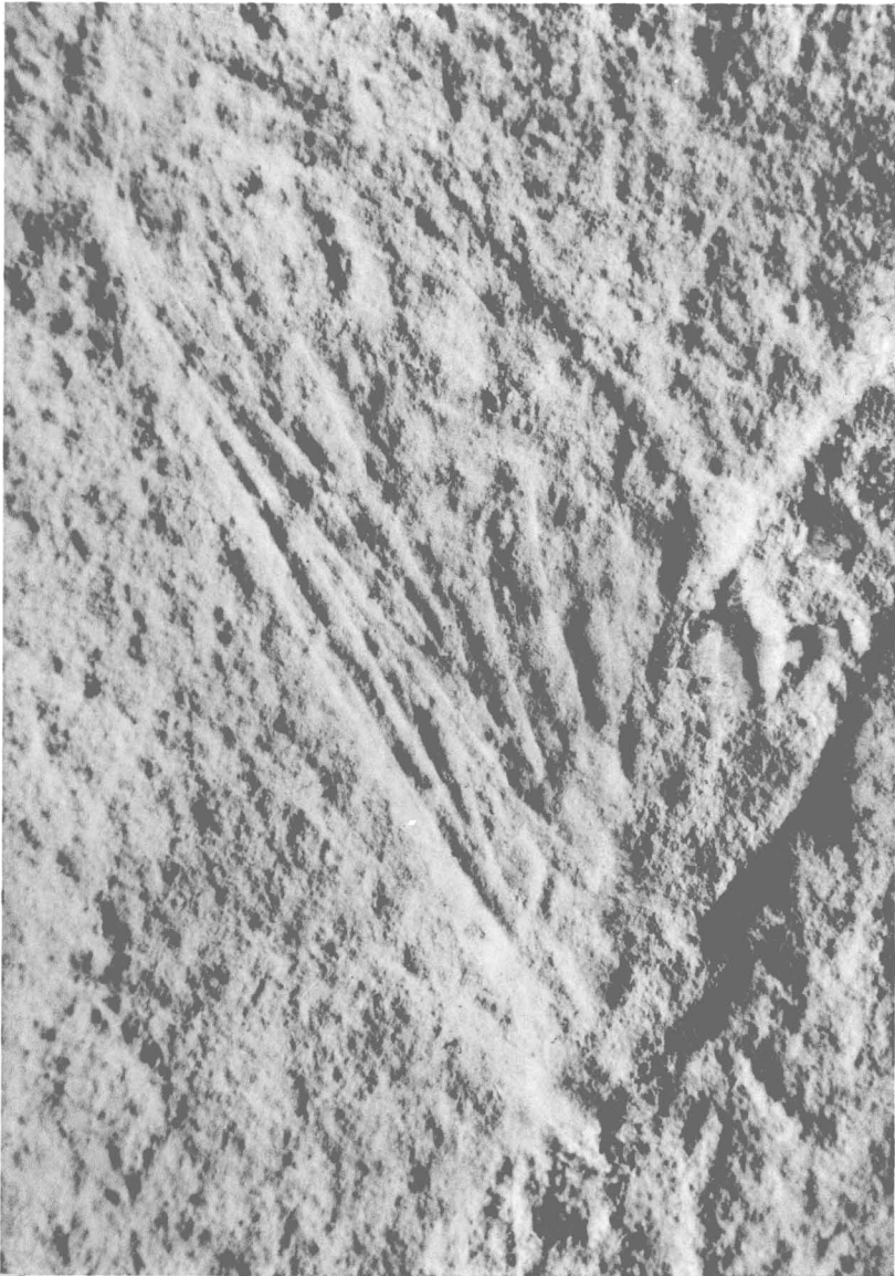
G. DEMOULIN. — Mesephemeridæ d'Europe centrale.