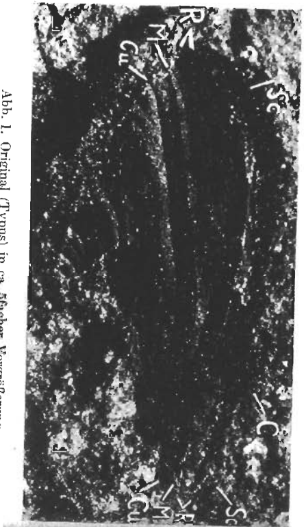
Abb. 1. Original (Typus) in ca. 5facher Vergrößerung.

Auf Grund eigener Vergleiche habe ich von Anfang an den Fund für ein Lepidopteron angesprochen. Der bekannte Paläontologe HERMANN HAUTER in Halle/Saale war so freundlich, mir auf eine Anfrage hin mitzuteilen, daß auch er das Stück für einen Schmetterling halte. Störend seien nur die vielen Querradern, die auf der ihm zur Gleichzeitigkeit teilte er mir mit, daß Vergleiche mit rezenten und fossilen Formen nur unter erheblichen Schwierigkeiten möglich seien. In Frage kämen nur Micropterygidae, winzige Tierchen, die anstatt des sonst vorhandenen Saugrüssels noch kanuende Mundteile besitzen. Diese besitzen nach HAUTER auch noch im Flügel die ihrer ganzen Länge